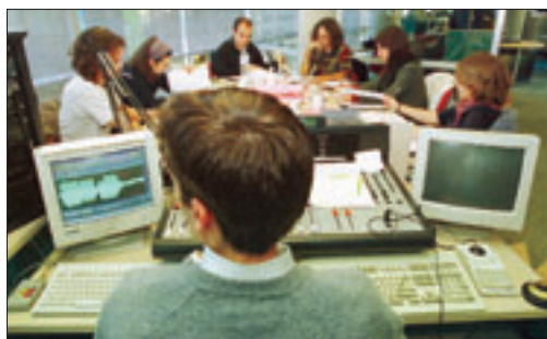
►► El jurat del premi, dissabte a Andorra 1.

Relk actuarà dissabte que ve a l'Àngel Blau, on també rebrà els 1.800 euros del premi organitzat pel Centre de la Cultura Catalana i dotat per Crèdit Andorrà. Curiosament,