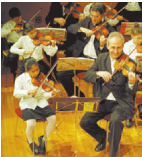
►► El concert ► Claret i una petita intèrpret.